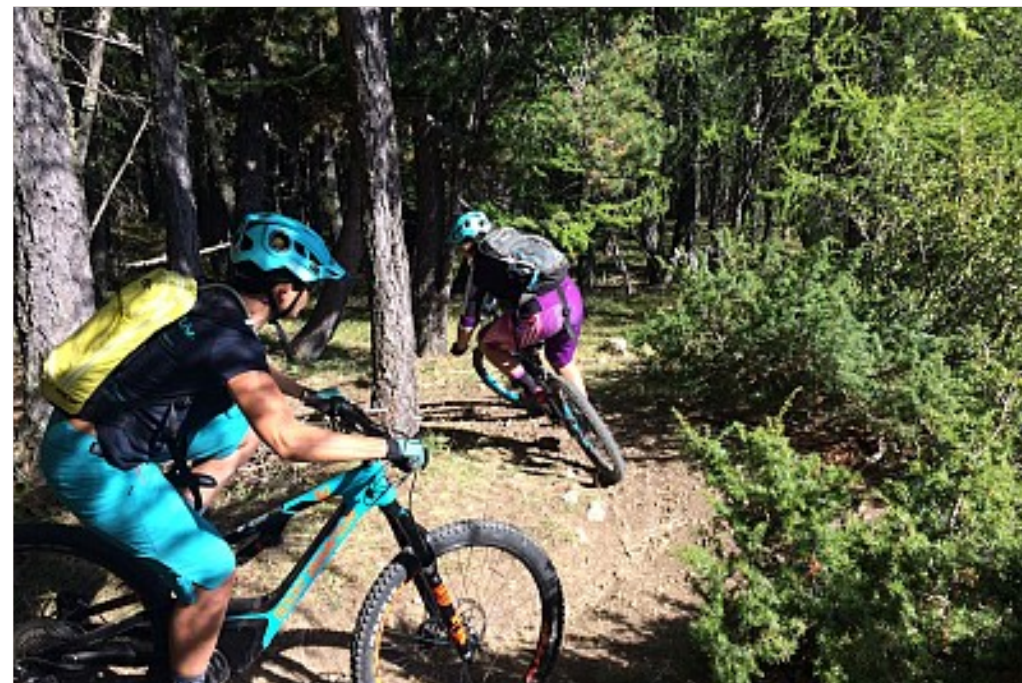
Tribe Sport Group